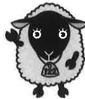
羊のイメージキャラクター 「めん子ちゃん」