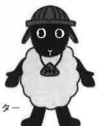
羊のイメージキャラクター 「イケめえんくん」